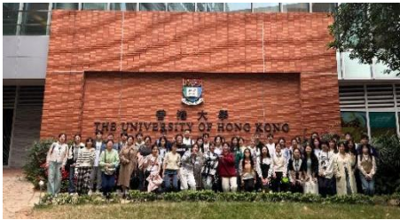
参访交流：香港大学