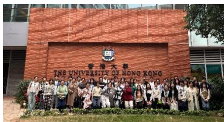
参访交流：香港大学